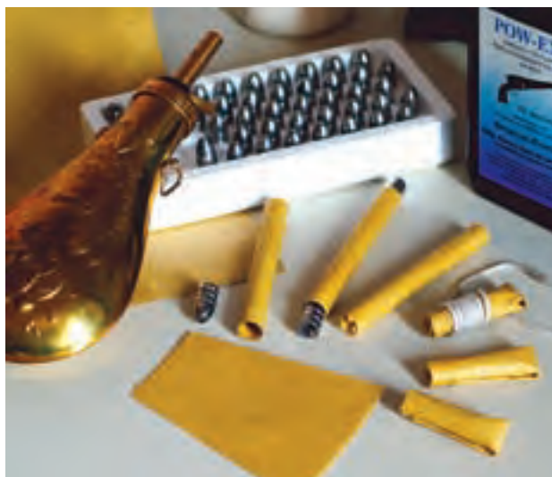
A destra: l'allestimento delle cartucce secondo le modalità dell'epoca. Seppure i cacciatori preferissero dosare sul momento la polvere per le diverse necessità del tiro, una piccola quantità di cartucce già pronte poteva essere utile nel caso di dover sparare con una cadenza più veloce.