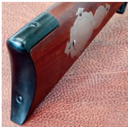
A sinistra: il calciolo metallico ha una discreta piega, che aiuta ad ammortizzare il rinculo anche se non si rivela del tutto adatta a spalle "magre".

L'arma è rimasta a lungo nella sua custodia prima di essere provata, complice un incidente stradale che mi ha bloccato la mano destra per molti mesi. Alla fine, però, sono riuscito a sparare di nuovo con quest'arma dal peso notevole. È stato il primo fucile con il quale ho ricominciato a sparare ed è stato un piacere tale riprendere l'attività che in pochissimo tempo ho esaurito tutta scorta di palle consegnatemi per il test. Ho così dovuto metter mano alle palle fuse in casa, realizzate in teoria solo per provare il fondipalle che faceva parte della dotazione di accessori da usare per realizzare l'articolo. Per rendere più divertente il tiro, invece del solito test da