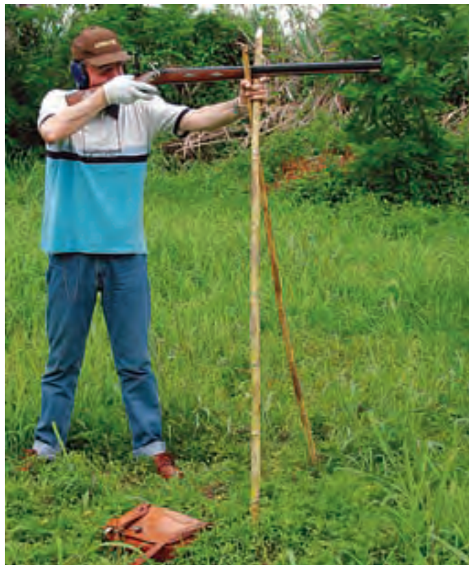
La prova a fuoco è stata eseguita in piedi con appoggio su forcella, alla distanza di 100 metri.

gli handicap personali, positive. Molto valido lo stecher , tra i più costanti della sua categoria, ottima la diottra, la cui estensione di 50 mm è più che sufficiente per il tiro a 100 metri. La piega del calcio aiuta ad ammortizzare il rinculo, anche se la conformazione del calciolo metallico è poco adatta a una spalla magra. Specialmente con l'uso di dosi di 90 grani di polvere, il contraccolpo si fa sentire, cose da uomini rudi!