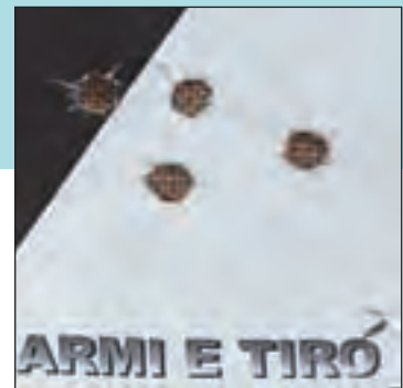
Rosata di quattro colpi in 50 mm ottenuta a 100 metri con palla Minié di 310 grani e 50 grani di polvere Wano Fffg.

seduto, con l'arma appoggiata sul rest , ho voluto cimentarmi con il tiro in piedi con forcella d'appoggio, un metodo sicuramente applicato in origine dai cacciatori armati dei Tryon originali.