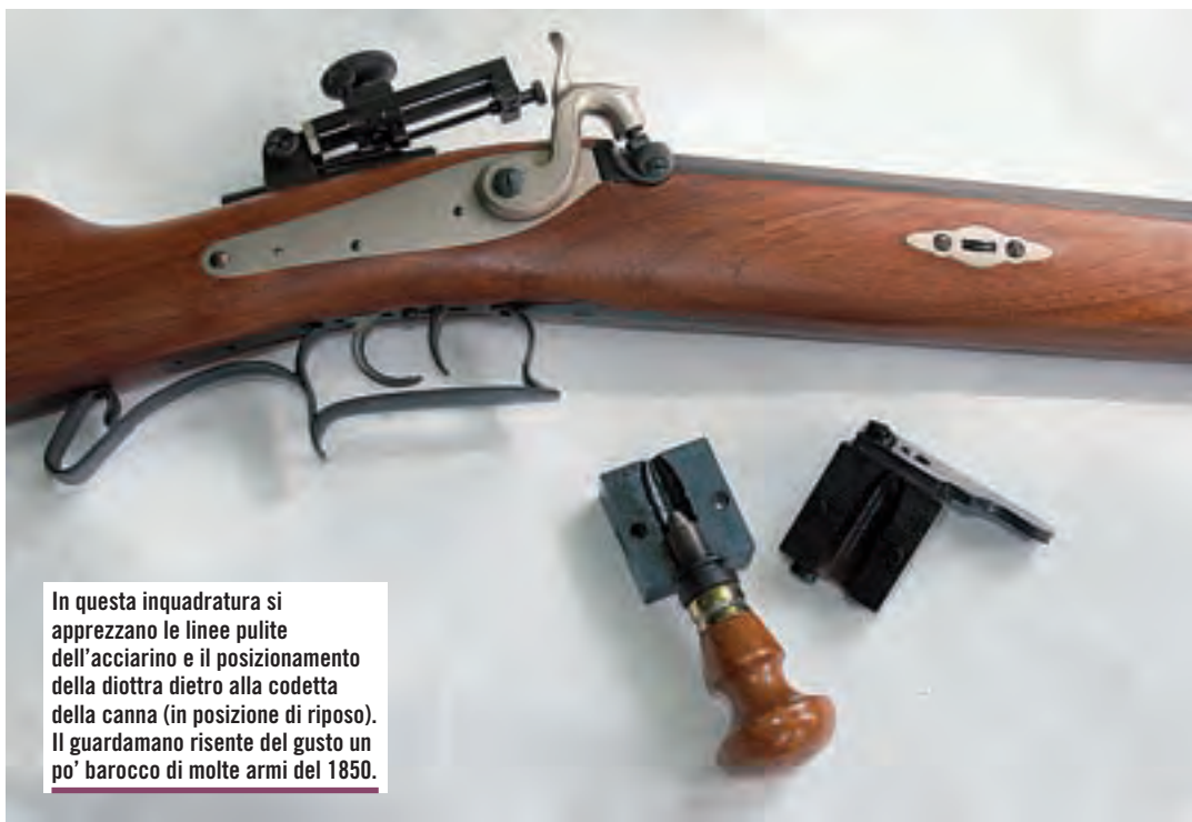
In questa inquadratura si apprezzano le linee pulite dell'acciarino e il posizionamento della diottra dietro alla codetta della canna (in posizione di riposo). Il guardamano risente del gusto un po' barocco di molte armi del 1850.

L'acciarino a molla indietro è di costruzione semplice e accurata, con una risposta in termini di velocità di caduta del cane molto buona. La sua conformazione risponde appieno all'esigenza di sottrarre i meccanismi all'effetto deleterio dei residui di sparo. Per questo, la lavorazione dell'incassatura è molto accurata, proprio per evitare il trafilamento di fecce e di fumi durante il tiro. La generosa sezione dell'impugnatura del calcio contrasta l'eventuale indebolimento che deriva dalla posizione arretrata della batteria. La pesante canna ottagonale, nella versione da tiro, è lunga 820 millimetri, con uno spessore